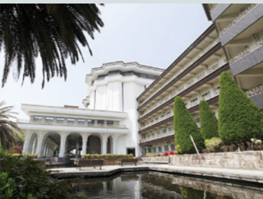
学園の創設者である藤田啓介総長自らが設計に携わった多目的ホール「フジタホール 2000」

藤田学園は1964年の創立以来、“独創一理”の建学理念を掲げ、先端的な医療科学の発展と、広範な分野にわたる医療人の育成、患者の立場に立ったトップレベルの医療の実現に向けて半世紀以上取り組んできた。同学園はすでに3万2000名を超える多様な医療職の卒業生を世に送り出しており、藤田医科大学病院をはじめ、4つの教育病院で優れた知見と技量を有する多数の医師が献身的な多職種スタッフとともに高度な医療を提供し続けている。