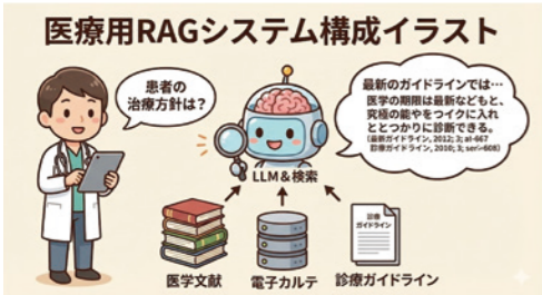
医療用RAGのシステム構成イラスト。LLMとRAGを組み合わせたAI技術で、複雑化・高度化した診療ガイドラインや安全管理基準を機械可読化。医師のオーダーや臨床判断をリアルタイムに支援する。

「最近では、看護師長から勤務スケジュール表作成の効率化に関する要望があります。既存の勤務管理システムにも自動化機能は付属されているのですが、同機能は人間関係や個別事業を考慮・反映することができず、現場からは実用的でないと囁かれてきました。AIでこれまでの勤務スケ