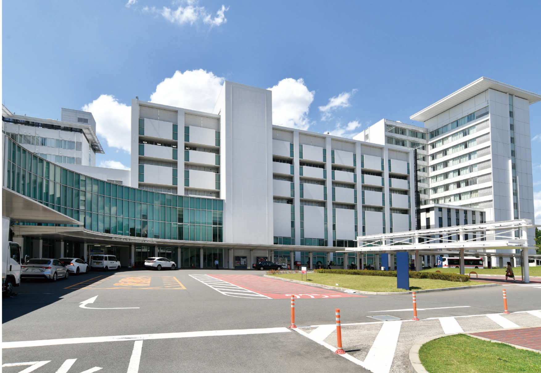
藤田医科大学病院は、藤田学園が有する5病院中、最大規模のもので、許可病床数1376床は本邦大学病院中でも最大となっている。病院建物はA棟、B棟、C棟、外来棟、放射線棟、検査棟、フジタモールからなり、各棟は渡り廊下で結ばれている。