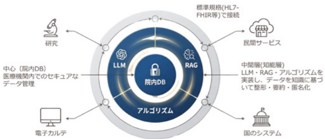
MIG (Medical Intelligent Gateway) イメージ図。MIGは既存システムと未来のサービスをつなぐ「知的ゲートウェイ」。医療機関自身のガバナンスのもと、データを安全に標準化・構造化する共通基盤である。