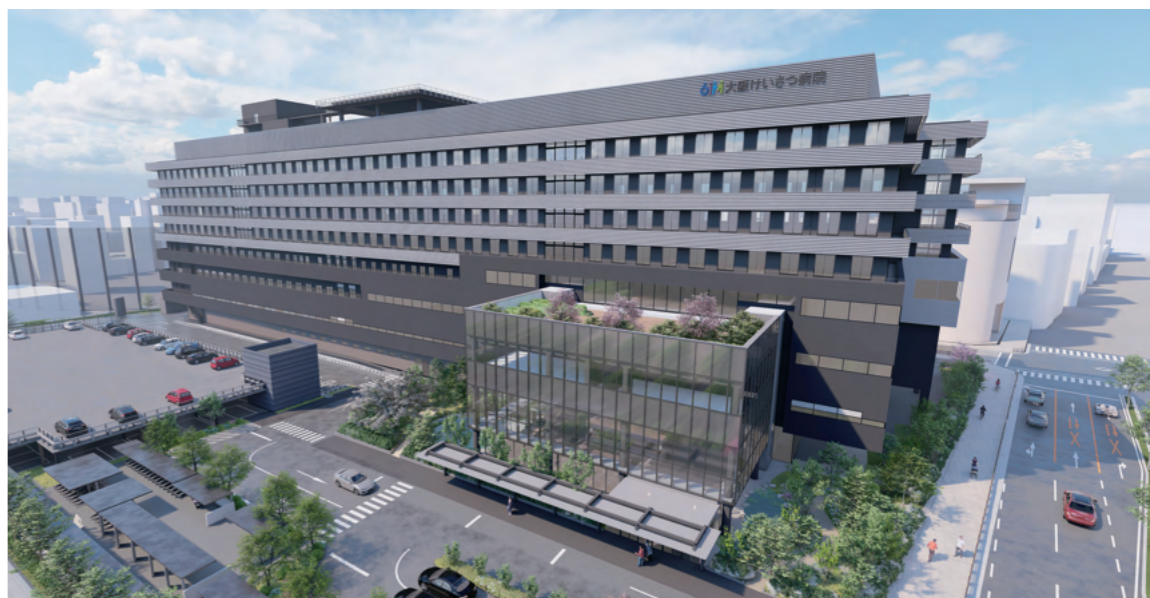
2027年グランドオープン時の大阪けいさつ病院イメージ図。第2期工事によって旧・大阪警察第二病院跡地に立体駐車場やエントランス棟を設け、患者の利便性や職員を含むコミュニティの場としての機能をさらに充実させる計画を進める。

その中には、来院受付から会計支払いまでをシームレスに実現する患者用のスマートフォン・アプリケーションの開発や医療情報銀行とのデータ連携、そして医療情報の活用用の基盤である医療情報システム情報統合基盤の構築も含まれます。