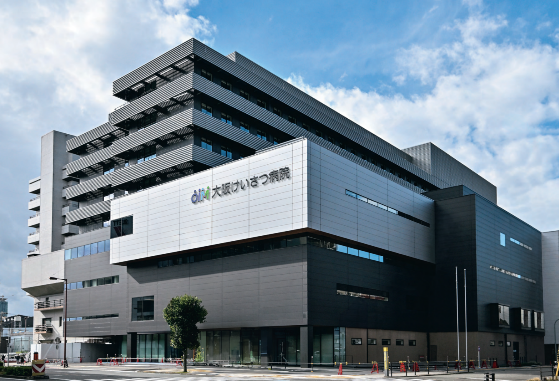
2025年1月に新築・オープンした大阪けいさつ病院外観。敷地面積1万6696.79㎡、延床面積5万5593.83㎡、地上8階・地下1階、免震構造の建屋を持ち、病床数650床、集中治療室65床を設置するなど、最先端の医療を提供するための環境が整備されている。